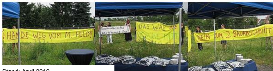
Stand: April 2019

Nicht nur die Bewohner der fünf umliegenden Stadtteile schätzen das Naherholungsgebiet, sondern auch Spaziergänger, Jogger und Radfahrer aus ganz Bonn und Umgebung.